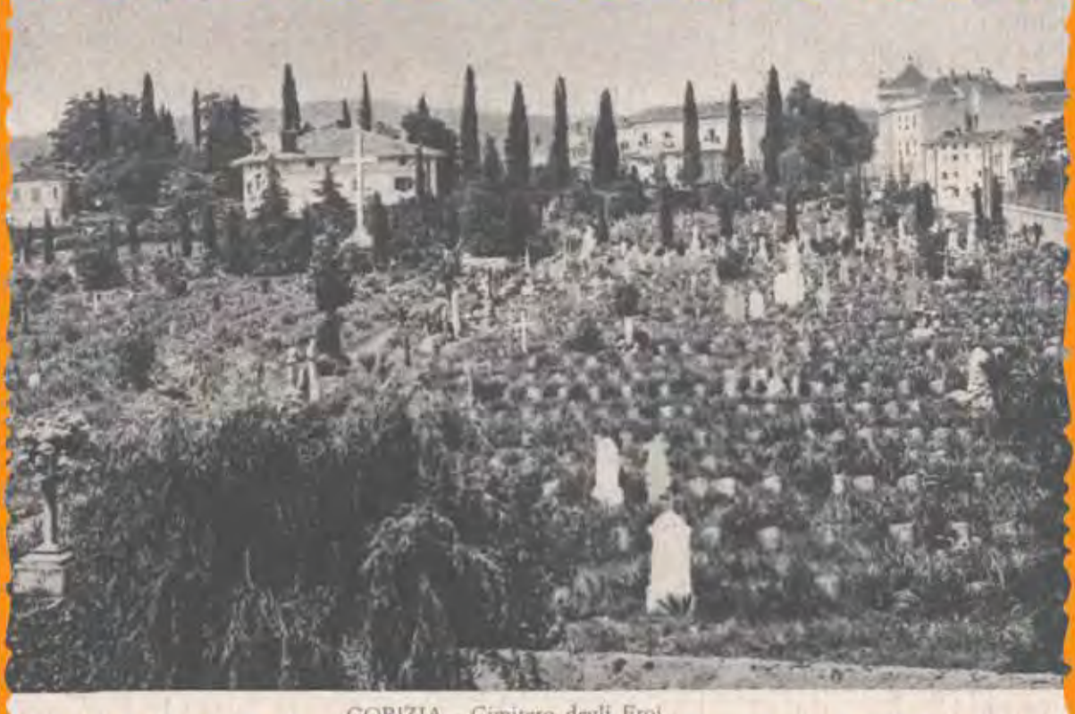
GORIZIA - Cimitero degli Eroi.