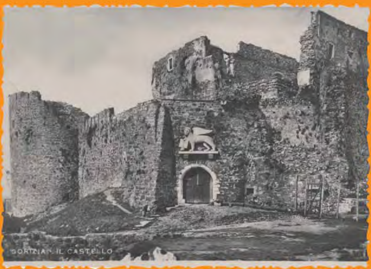
GORIZIA - IL CASTELLO