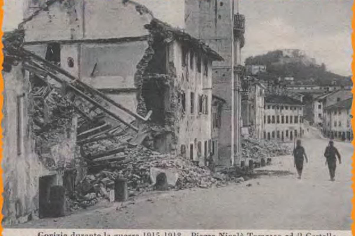
Gorizia durante la guerra 1915-1918 - Piazza Nicolò Tomaseo ed il Castello.