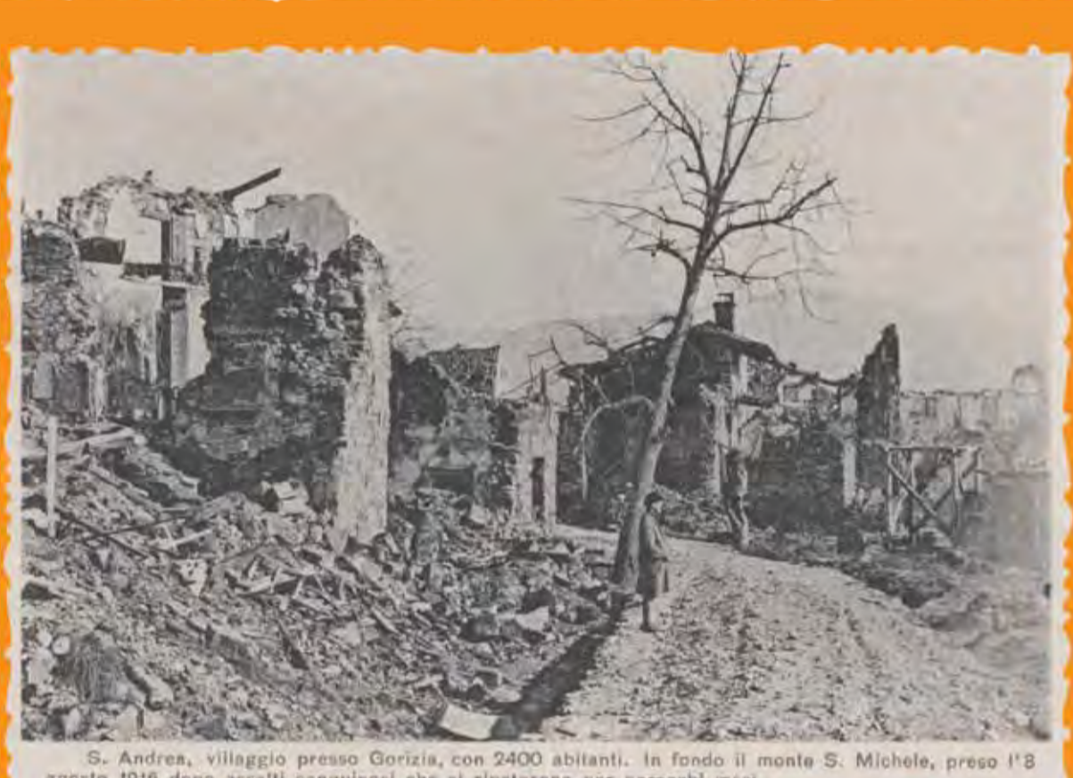
S. Andrea, villaggio presso Gorizia, con 2400 abitanti. In fondo il monte S. Michele, preso l'8 agosto 1915 dopo assalti sanguinosi che si ripeterono per parecchi mesi.