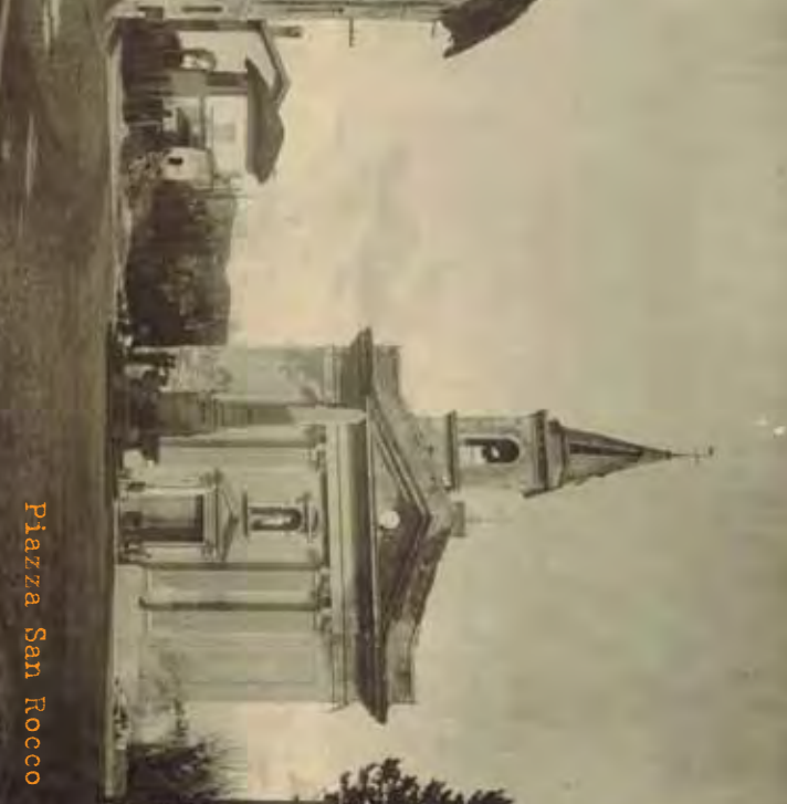
Piazza San Rocco

GORIZIA FRA MACERIE E GRANATE CORREVA L'ANNO 1915