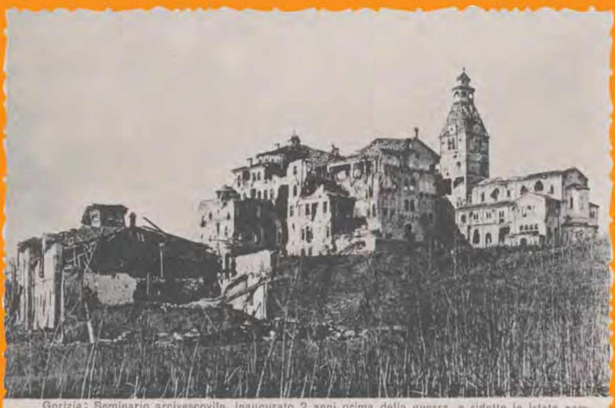
Gorizia: Seminario arcivescovile, inaugurato 2 anni prima della guerra, e ridotto in istato compassionevole durante i combattimenti sul S. Marco.