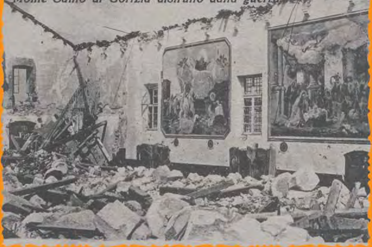
Monte Santo di Gorizia distrutto dalla guerra