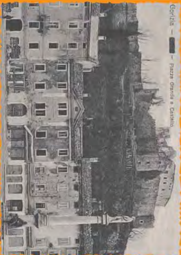
Gorizia — — Piazza Grande e Castello

L'anno terribile per Gorizia fu proprio il 1915. La città venne colpita innumerevoli volte con danni alle persone e alle costruzioni. Quei mesi di guerra cambiarono per sempre il volto della città e del Borgo di San Rocco. Queste cartoline raccontano Gorizia tra il 1915 e il 1916.