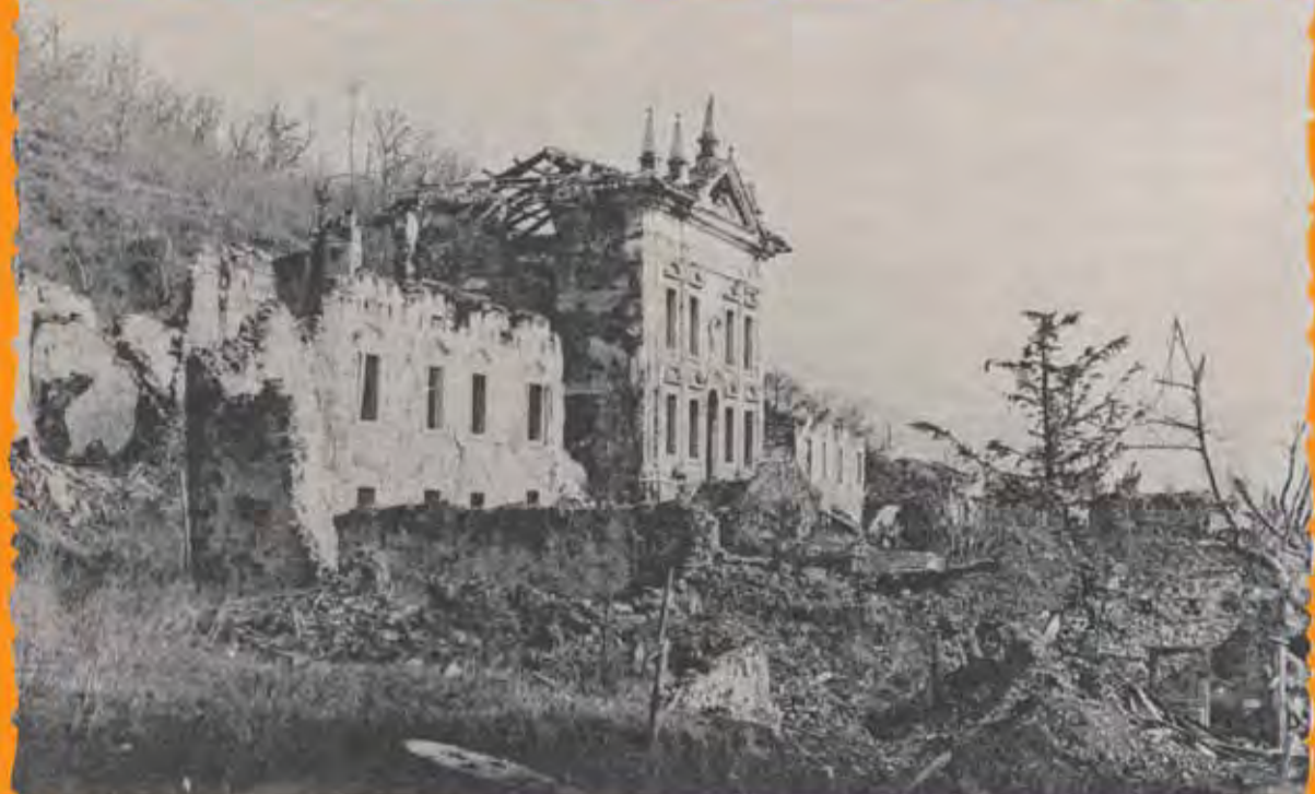
Il Palazzo Conti Attemis in Podgora presso Gorizia, a piedi del Calvario, preso l'8 agosto 1915 dopo 10 mesi di terribili e continui combattimenti.