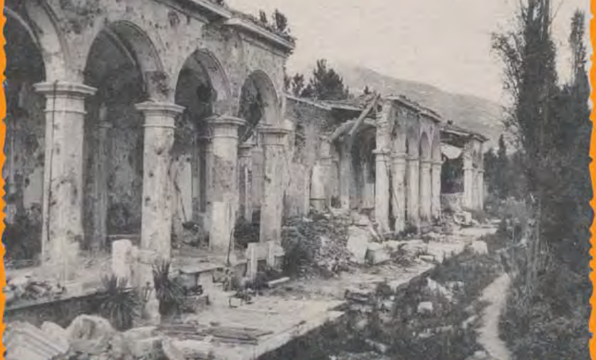
GORIZIA - Cimitero - Parte Monumentale

AUSGEFÜHRT IM ATTELIER. PROF. H. KAMUTSKY u. F. ROTTOMARA.