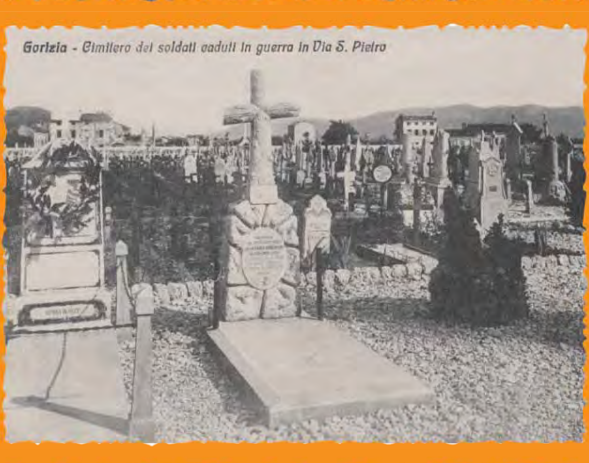
Gorizia - Cimitero dei soldati caduti in guerra in Via S. Pietro